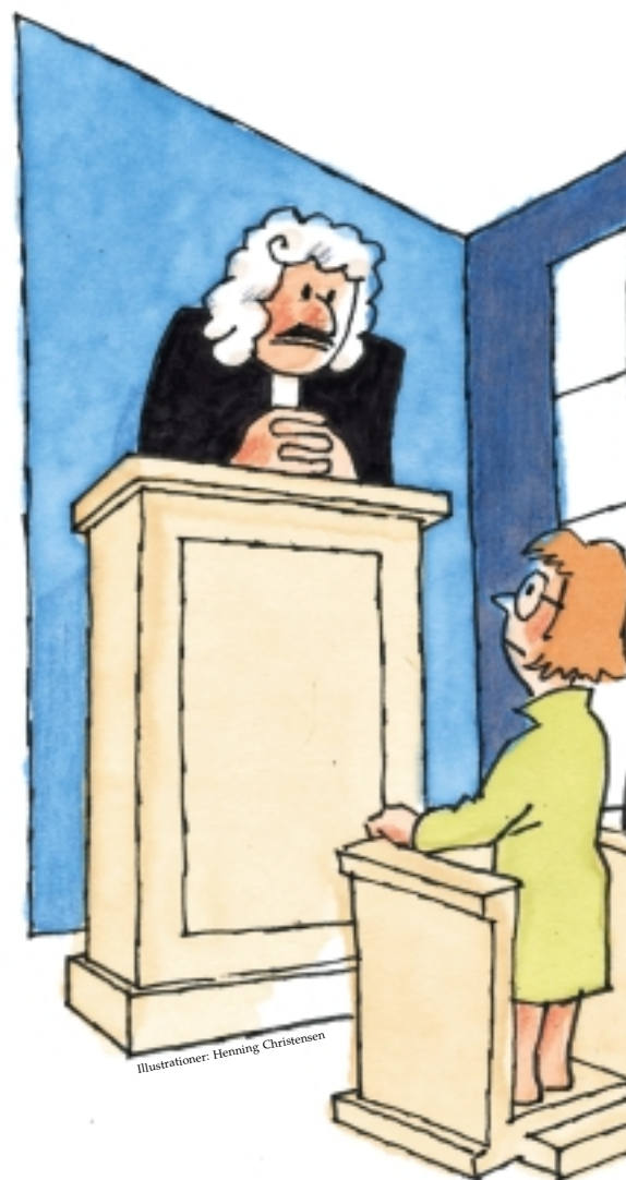
Illustrationer: Henning Christensen

Disse ændringer i landets love medfører altså, at en stor del af de problematikker, Etiknævnet tidligere tog sig af, nu kan behandles af de offentlige nævn og landets domstole. Tilbage til Etiknævnet bliver vel kun klager over ikke-autoriserede psykologer, der ik-